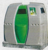
le bac à verre