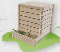
le composteur dans le jardin