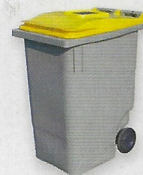
le bac jaune (papier, carton, bouteille en plastique, etc.)