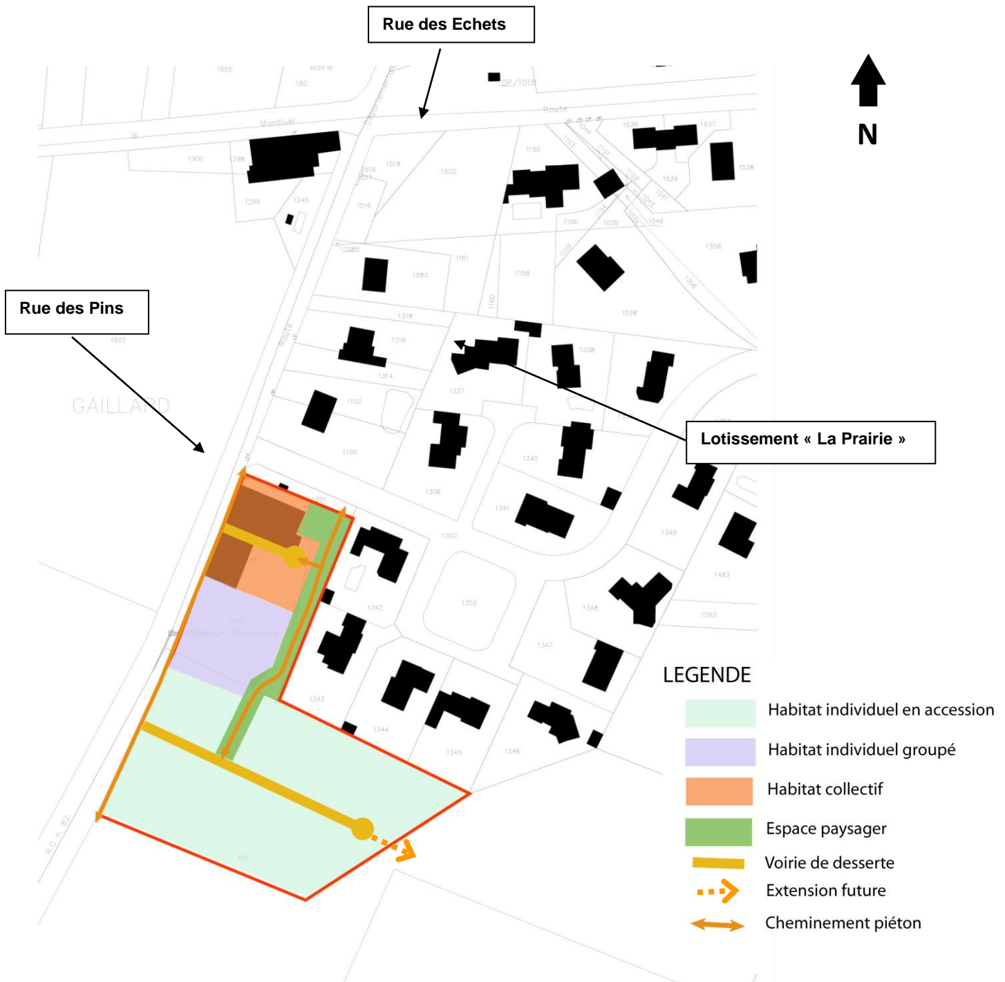
Schéma de l'OAP du PLU en vigueur 24/02/2014 – avant MS - Sans échelle