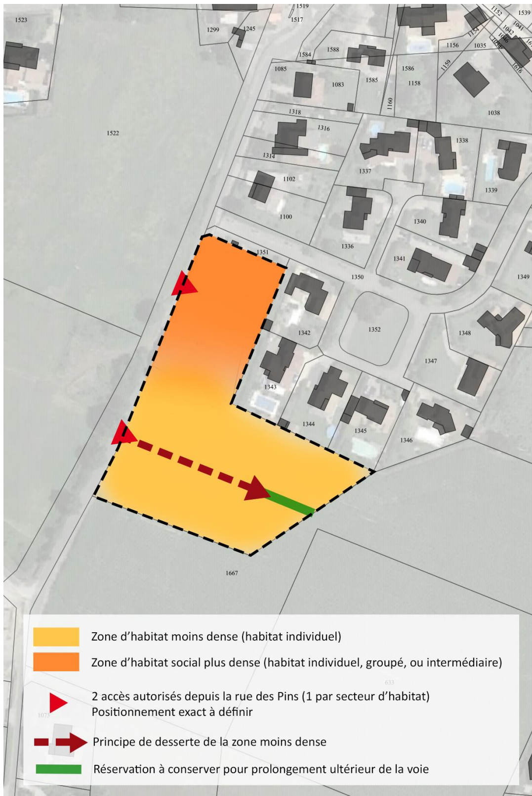
Schéma de l'OAP après MS - Sans échelle

Le schéma de synthèse de l'OAP est ainsi modifié.