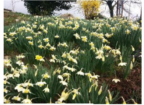
Narcisses rue des Pins